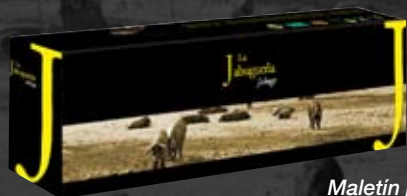
Maletín jamonero de lujo