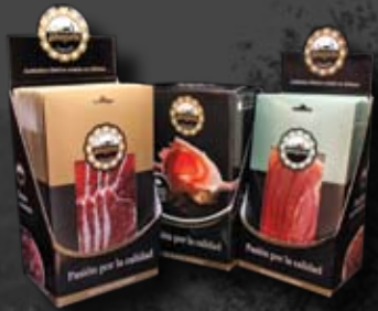
Surtido de Loncheados