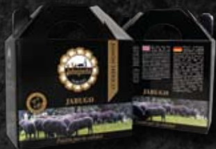
Cofre especial Taco Ibérico o Serrano (1 Kg)