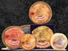
Surtido de Quesos